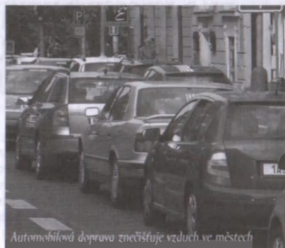
Automobilová doprava znečišťuje vzduch ve městech

Naše ekologické jednání či nejednání s ohledem na bližní a na Boží stvoření zde tudíž možná bude, ale možná nakonec vůbec nebude sehrávat důležitou roli – avšak zmínka o čemkoliv, co jsme učinili nebo učinili a případně mohli učinit komukoliv z našich nepatrných bratří, jak o tom čteme v Evangelii sv. Matouše, 25. kapitole, by zřejmě pro nás měla být i v rovině ekologické důvodem k nejvyšší pozornosti a opatrnosti.