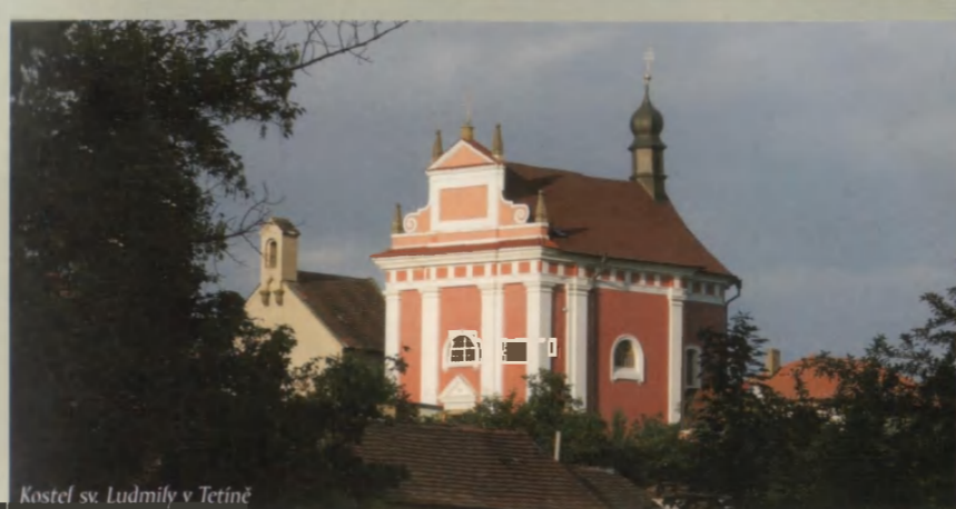
Kostel sv. Ludmily v Tetíně