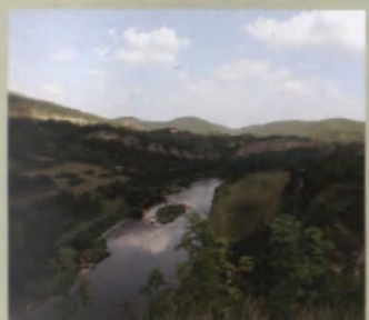
Pohled na Berounku z ruin hradu Tetín