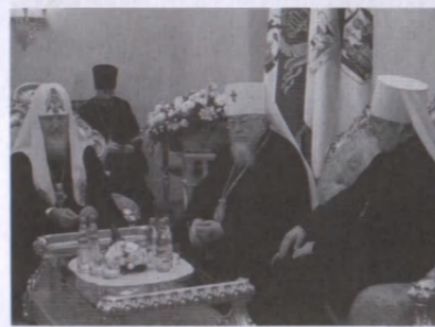
Polský metropolita Šáva a metropolita Kryštof na návštěvě u patriarchy Kirilla

Střelcová a vydavatel časopisu Ikona Ina, Igor Střelec. Oslav narozenin se kromě metropolitů Kryštofa zúčastnily i hlavy dalších autokefálních církví, např. gruzínský patriarcha katolikos Eliáš II., metropolita Šáva varšavský a celého Polska a další. Oslav se účastnili rovněž zástupci diplomatických sborů, státu a veřejného života.