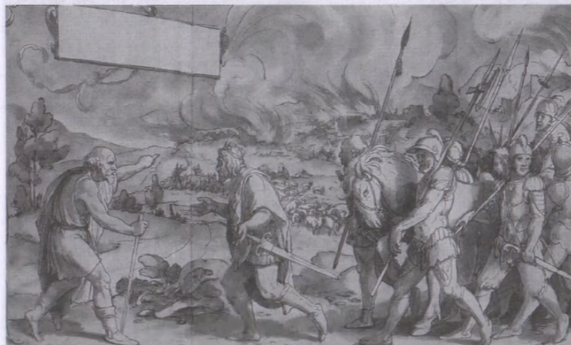
Hans Holbein mladší, Zavržení Saula

Nyní zřejmě nastal čas, aby Hospodinův slib byl splněn, aby byla z pod nebes vymazána památka na Amáleka, a Saul měl tento ortel vykonat. Samuel upozornil Saula, že vyhlazení Amáleka má být věčným