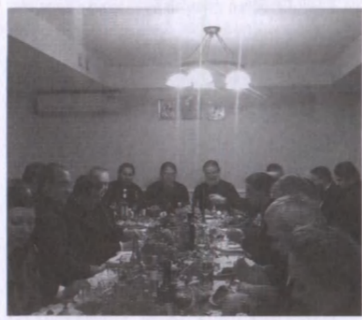
Večeře s věřícími a hosty na zastupitelství naší místní pravoslavné církve v Moskvě

Kirilla také pracovní setkání sedmi hlav či představitelů autokefálních církví, kteří vydali společně prohlášení k plánovanému pravoslavnému všeobecnému sněmu. Toto prohlášení je k dispozici v češtině.