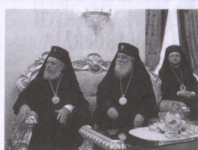
Zástupci pravoslavných církví při tvorbě prohlášení

Kirilla také pracovní setkání sedmi hlav či představitelů autokefálních církví, kteří vydali společně prohlášení k plánovanému pravoslavnému všeobecnému sněmu. Toto prohlášení je k dispozici v češtině.