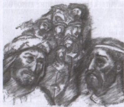
Ilustr. Karel Cyril Votýpka

Potom Samuel odešel do Rámy a Saul k sobě domů do Gibeje. Do své smrti už Samuel Saula nespasil, ale truchlil pro něho.