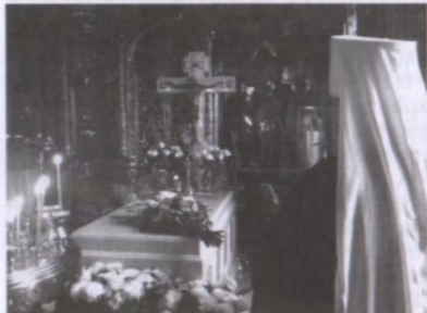
Metropolita Kryštof s delegací navštívili hrob patriarchy Alexije II.