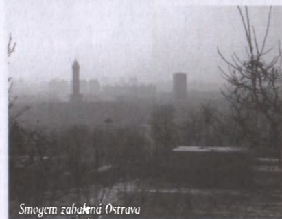
Smogem zahalená Ostrava

V rovině ekologické je pak zřejmé, že odmítání poznatků o tom, jak působí člověkem (a tudíž často i námi a kvůli nám) vypouštěné zplodiny jedy a plyny na kvalitu vody, vzduchu a půdy i na životy celé řady živých organismů (ostatní lidi a nás samotné samozřejmě nevyjímaje), je jednoznačným uhýbáním před odpovědností – odpovědností za poznatky, kterých se nám od Boha dostalo, a také popíráním elementárního požadavku nečinít jiným to, co sami nechceme. Odpovědnost zde jakožto lidé s těmito věcmi obeznámení máme nejenom vůči svým bližním, ale také vůči Stvořiteli, který nám svět světil, abychom vše, co je v něm, poznávali, pojmenovali a moudře spravovali. Netřeba asi připomínat, že jakožto Bohem stvořené svobodné bytosti máme také odpovědnost sami za sebe a za spásu či ztracení své nesmrtelné duše. (Je téměř vždy troufalé a naoukané, pokud se nějaký člověk domnívá, že ví, kde a jak skončí ta či jiná osoba ve věčnosti. Soud totiž patří jedině Bohu a – vezmeme-li v potaz také některé biblické texty – spravedlivým, kteří budou nakonec soudit svět...)