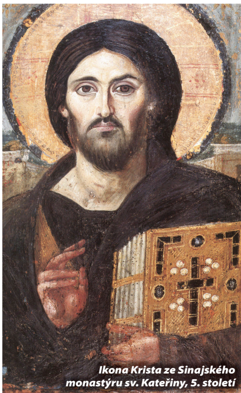
Ikona Krista ze Sinajského monastýru sv. Kateřiny, 5. století