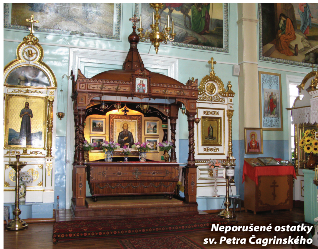
Neporušené ostatky sv. Petra Čagrinského