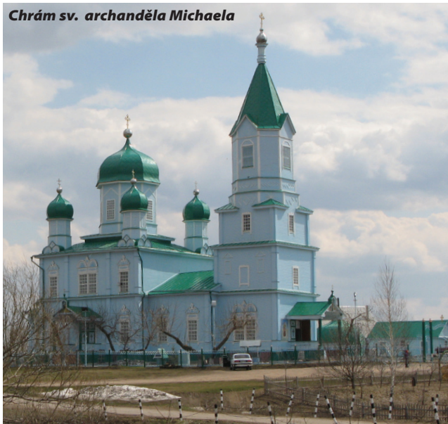
Chrám sv. archanděla Michaela

ství a v čele všech obcí celého regionu stála vždy duchovní autorita – „starec“. Mohl to být muž, ale i žena. Starce si nevolí věřící, starcem se nemůže stát svěvolně ten, který se za něho sám o své vůli prohlašuje. Starce těsně před smrtí vždy určoval svého následovníka. Tento nepřerušovaný řetěz následnictví pokračuje dodnes. „Starec není volitelná funkce, vybírá si ho sám Duch svatý.“