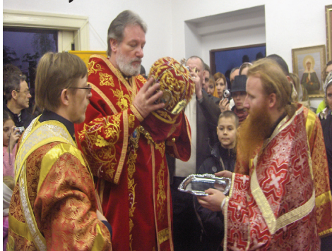
23. února 2008 – fotoreportáž ze svěcení monastýru sv. Václava a sv. Ludmily v Loučkách u Karlových Varů

V sobotu 23. února jsme posvětili novou budovu monastýru sv. Václava a sv. Ludmily v Loučkách u Karlových Varů. Je to má největší radost v letošním roce. Hospodinu Bohu sláva!