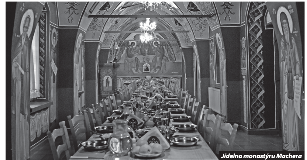
Jídelna monastýru Machera

P. Pešek. Ruská kuchyně v proměnách doby. Gastro-etno-kulturní studie. Pavel Mervart 2007. 237 stran. K dostání v běžné obchodní síti, na www.kosmas.cz nebo e-mailu nakladatelstvi@pavelmervart.cz .