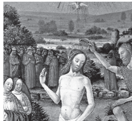
KŘEST V JORDÁNU