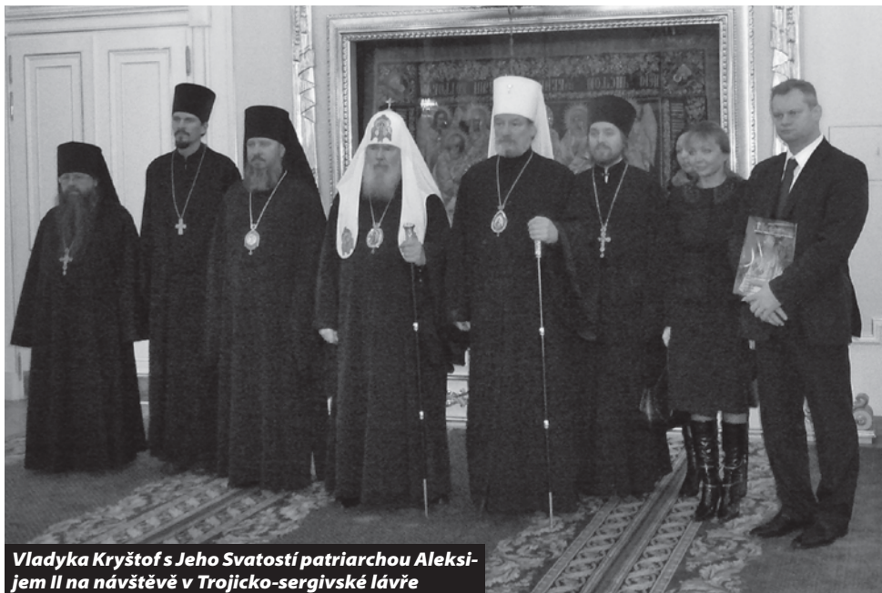
Vladyka Kryštof s Jeho Svatostí patriarchou Aleksijem II na návštěvě v Trojicko-sergiovské lávře

– starcem Naumem. Otec Naum mj. ve své promluvě zdůraznil nutnost a význam účasti na božské liturgii pro děti dokonce již v prenatálním období, a poté ihned po křtu malého dítěte. „Dnes,“ uvedl, „je mnohdy vidět, že děti jsou vnímány jako rušivý element a jsou dokonce často z chrámu odváděny a vyháněny. Pokud je chování dítěte opravdu nevhodné a neúnosné, je třeba chrám opustit, ale ihned, jakmile je to možné, je třeba se s dítětem vrátit do chrámu a rozhodně děti jakkoli nevykloučovat z běžného církevního života.“