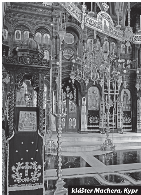
klášter Machera, Kypr

V některých zemích byly chrámy jedinými budovami, jež byly hodny jako stavebního materiálu kamene, vše ostatní mohlo být dřevěné, pomíjivé. Jako by si naši předkové lépe než my uvědomovali potřebu Boží ochrany a Boží přítomnosti v našem životě. V 19. století začaly místo kostelů ve městech zaujímat radnice, školy či nádraží – symboly moderních států, vzdělanosti a pokroku. 20. století začalo do center nových čtvrtí umísťovat domy kultury, nákupní střediska či sportoviště jako symboly relaxace, odpočinku a dostatku. Nic nám lépe neilustruje postupný úpadek duchovního života člověka jako proměna našich měst a postupné odsouvání chrámů na okraj pozornosti.