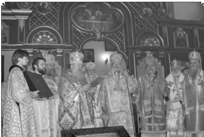
Ze slavnostní liturgie