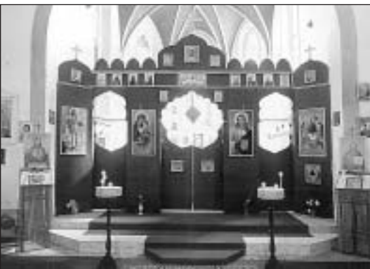
Pravoslavný chrám Přesvaté Trojice v Rokycanech

Zásadní a pro nás nejdůležitější zlom přináší podzim r. 2000, kdy Svatotrojický chrám přechází do výpůjčky nově vytvořené pravoslavné farnosti. Romští věřící lidé začali pozvolna s opravami a vedení církve našlo obětavého a dobrého člověka, který pravidelně splácí římskokatolické církvi již zmíněnou investici na záchranu střechy. Aktivně také pomohla plzeňská pravoslavná obec. Nastává tedy období oprav interiéru a konečně v únoru roku 2003 získává pravoslavná církevní obec v Rokycanech chrám do svého vlastnictví. Na jaře téhož roku se díky obětavé pomoci pravoslavných lidí z Rokycan, Plas, Kolína a chrámu Zvěstování přesvaté Bohorodice v Praze Na Slupi podařilo práce v interiéru dokončit.