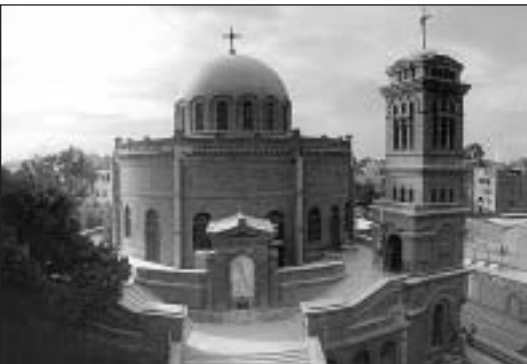
Chrám sv. Jiřího Vítězného, velikučedníka v Káhiře. V podzemí vězení a místo mučení sv. Jiří.

Jeho Svatost patriarcha Petr VII. po ukončení sv. liturgie pozdravil naši delegaci. Jeho Blaženstvo vladyka Nikolaj ve své odpovědi poděkoval vřelými a srdečnými slovy za pozvání i velmi milé pohostinství. Zdůraznil dále, jak jej potěšila účast Jeho Svatosti patriarchy na jeho intronizaci v Prešově v ro-