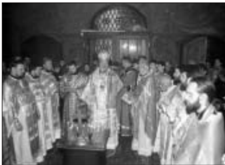
modlitby v chrámu Zesnutí přěsvaté Bohorodice

30. prosince 2003, v den výročí zesnutí Jeho Blaženstva, metropolitů českých zemí a Slovenska, vладыky Doroteje, se v Praze v chrámu Zesnutí přěsvaté Bohorodice ko-