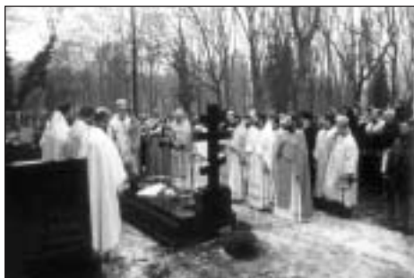
modlitby u hrobu drahého vладыky metropolitu Doroteje

od sebe musíme začít), ale myslí také na ty, kteří tě obklopují, setkávají se s tebou a at chceš nebo nechceš, spoluvytvářejí tvůj život. Křesťan jim říká „moji bližní“. Pro člověka věřícího v Krista je bližním každý člověk, at patří do osobní rodiny nebo je svým původem či postavením vzdálen.