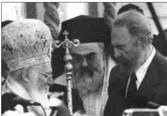
Vysvěcení havanské katedrály sv. Mikuláše se kromě konstantinopolského patriarchy Bartoloměje I. (vlevo) účastnil i kubánský vůdce Fidel Castro (vpravo) a členové jeho vlády.

Katedrála sv. Mikuláše byla postavena v srdci koloniální Staré Havany v blízkosti