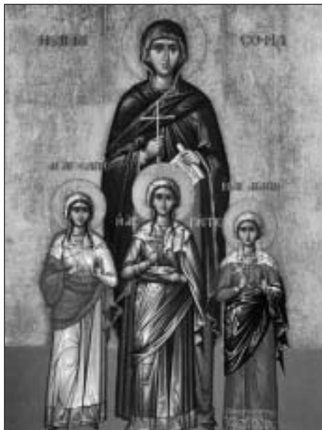
Ikona svatých mučednic

Svaté dívky prožívaly nevidaná muka. Přitom oslavovaly svého Nebeského Ženicha a s radostí přijaly mučednické věnce. Byly sťaty mečem.