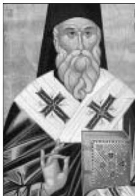
sv. Nektarios Eginský

V té době byl vladyka Nektarios ještě ředitelem v Athenách. Život v obnoveném monastýru se snažil z dálky organizovat podle svatooteckých pravidel. Někdy byl hodně přísný, ovšem tak, jako milující otec, který chce vychovat děti k dobrému. Je to viditelné i z jednoho dopisu adresovaného monaškám: „Dostal jsem váš dopis a vidím, že se trápíte. Svědčí to o úrovni vašeho duchovního života a slabosti. Chtěl bych, abyste věděly: budu dělat vše, abych zachoval pravidla svatých otců, abych vás vychoval k obětavosti a trpělivosti. Přišel čas, abyste na sebe