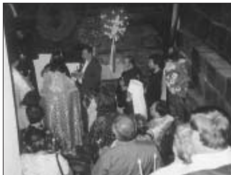
Panychida mezi ostatky statečných.

Zde v Jindřichovicích jsme si zvláště naléhavě uvědomovali duchovní spřízněnost českého národa s národem srbským a českého gorazdovského pravoslaví, které se k nám navrátilo přes Srbsko. Potvrzoval to i spřízněný liturgický jazyk svatých Cyrila a Metoděje.