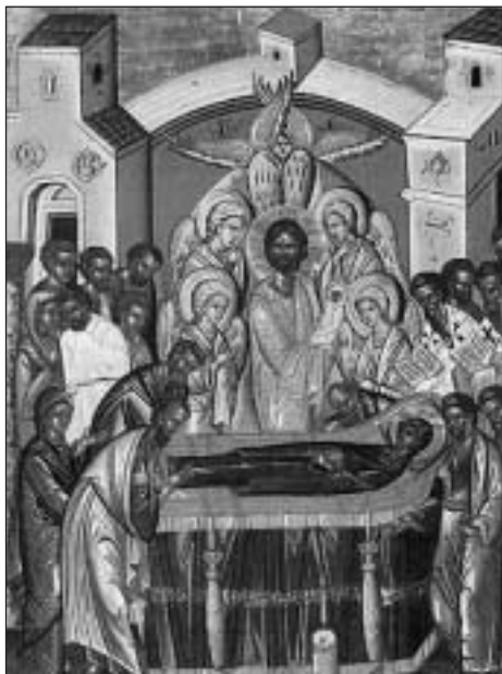
Ikona Zesnutí přesvaté Bohorodice

Podle pověsti uplynuly další tři dny a Tomáš, který nebyl přítomen jejímu loučení, se vydal sám k jejímu hrobu. V prázdném otvoru však už zahlédl pouze odloženou pláštěnici. Zato ke svému údivu spatřili záhy Kristovu Matku všichni živou ve večeradle po boku jejího zmrtvýchvstalého Syna. Slíbila jim tam, že je už nikdy neopustí a že od té chvíle bude naslouchat všem, kdo se k ní kdy s důvěrou obrátí. Nyní je společnou Matkou nás všech. Stala se první lidskou bytostí, na níž se naplnil Synův příslib theose (daný všem lidem neochvějně víry).